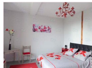
La chambre d'hôte