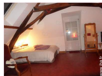
La chambre d'hôte