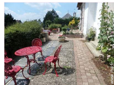
vue sur cour