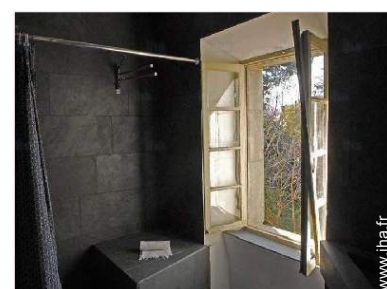
Agencement intérieur et commodités