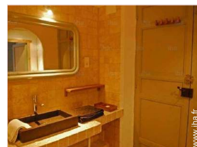
Agencement intérieur et commodités