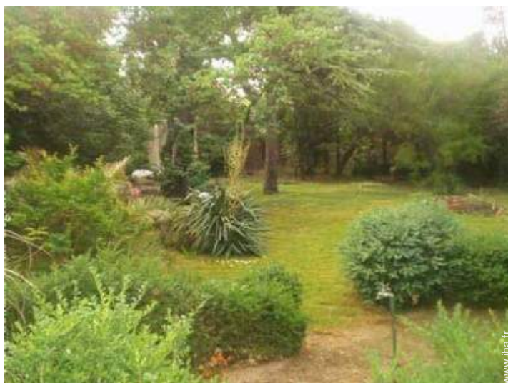
vue sur jardin/parc