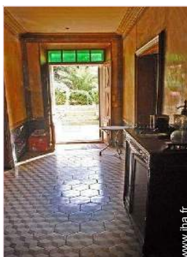
vue sur village