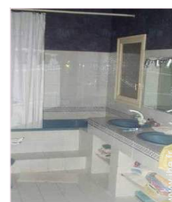
Agencement intérieur et commodités