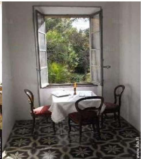
vue sur jardin/parc