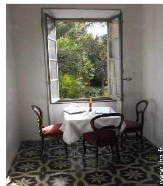
vue sur jardin/parc

Plage de sable 40km Piscine publique 20km Court de tennis public 200m Rivière 10km Massif montagneux 10km