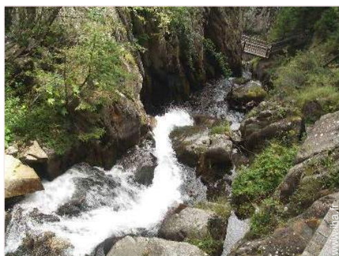
chemin de promenade