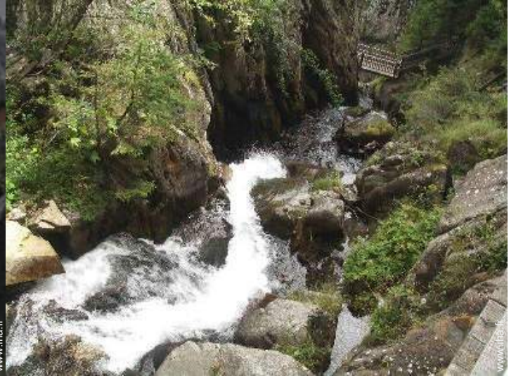
chemin de promenade