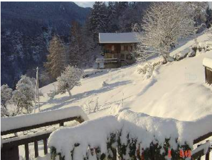
liaison bus pistes de ski