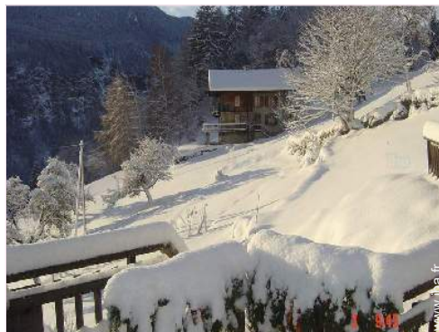
liaison bus pistes de ski