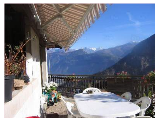
vue depuis la terrasse

Remontées mécaniques Piscine chauffée 1,5km Piscine publique 1,5km Court de tennis public 1,5km Cascade 500m Rivière 1,5km Lac Forêt <50m Massif montagneux <50m