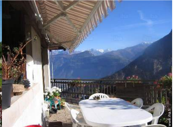
vue depuis la terrasse