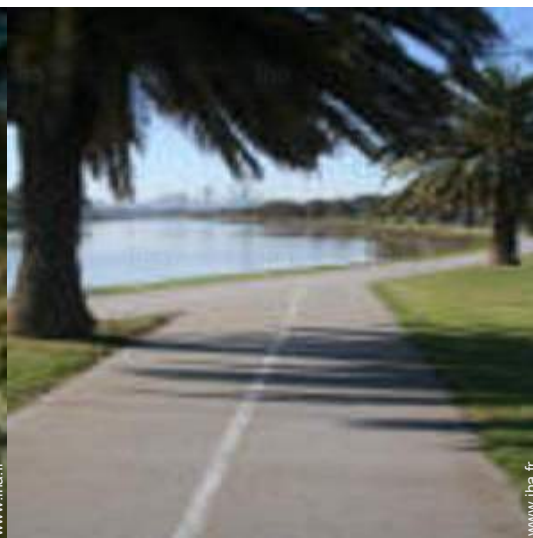
Attraits et détente