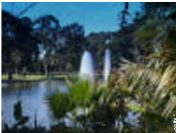
parc et jardin