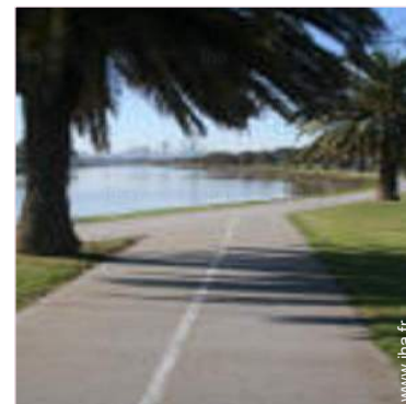
Attraits et détente

T.V., vaisselle/couverts, chaine hifi, lecteur DVD, jeux de société, wifi, radio-réveil, sèche-cheveux, moustiquaire aux fenêtres, lave-linge, intégralement climatisé, fer à repasser, ventilateur mural, chauffage électrique