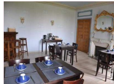
Confort intérieur à disposition des hôtes