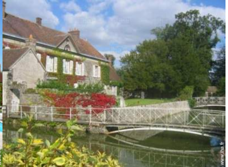
vue de la propriété