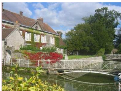
vue de la propriété