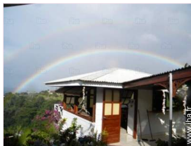
vue depuis le balcon