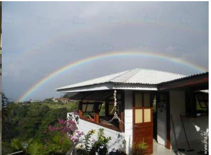
vue depuis la maison