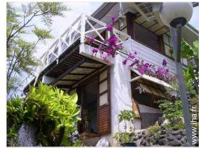
La chambre d'hôte