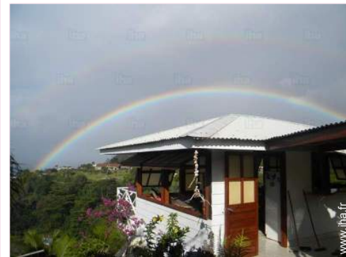
vue depuis la maison

Mer/océan 1,5km Plage de sable 1km Plage de galets 2,5km Plage de rocher 1km Piscine publique 10km Parcours de golf 18 trous >50km Spot de windsurf 500m Spot de surf 2km Base nautique 3km Cascade 7,5km Rivière 4km Massif montagneux 7,5km Cale de mise à l'eau pour bateau 1km Cale de mise à l'eau pour jet-ski