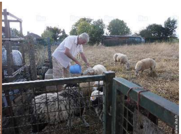
vue sur champs agricoles