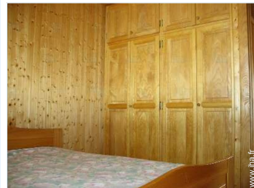
Couchage - lit(s)