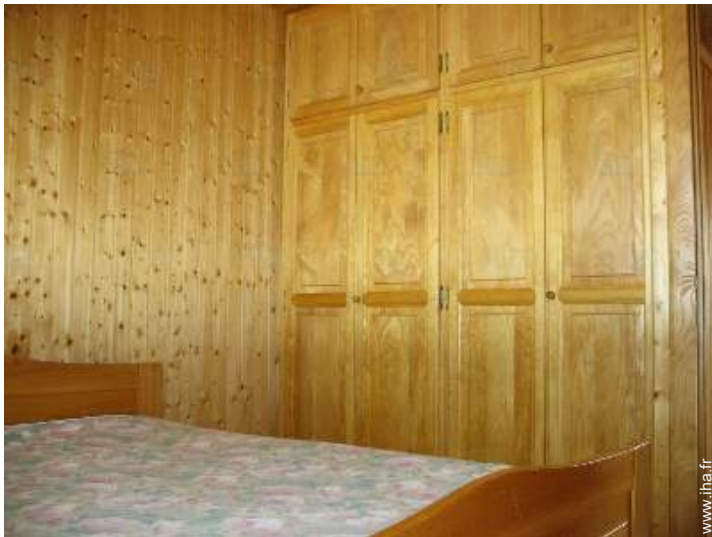
Couchage - lit(s)