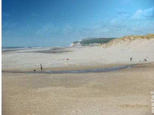
plage de sable