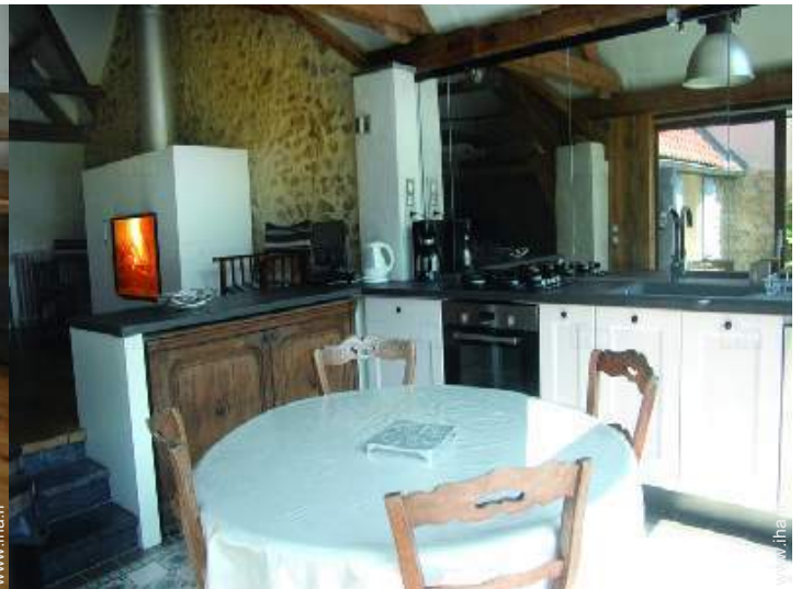
vue depuis la cuisine