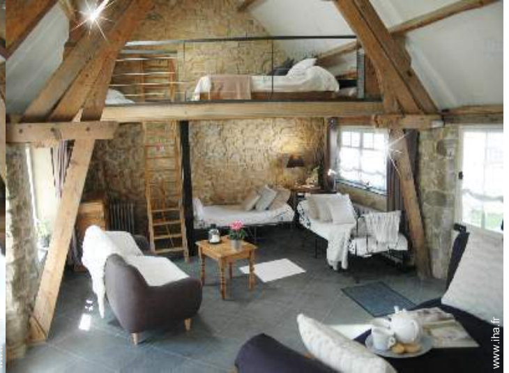
Propriété de Charme