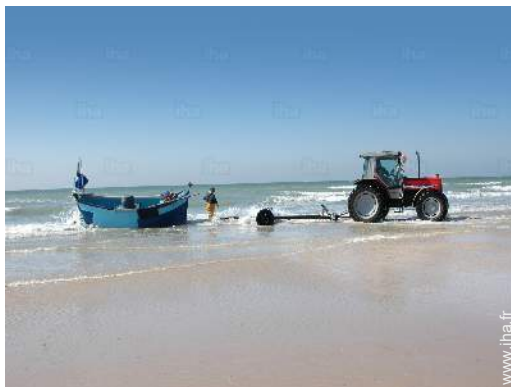
plage de sable