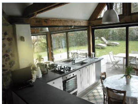
vue depuis la cuisine