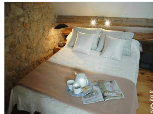
vue depuis la mezzanine

Mer/océan 300m Plage de sable 300m Piscine publique 10km Court de tennis public 800m Spot de windsurf 300m Falaise 15km