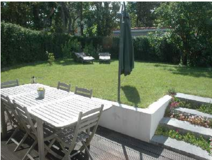
vue sur jardin/parc