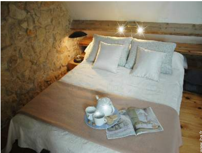
vue depuis la mezzanine