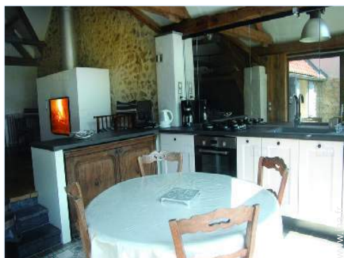
vue depuis la cuisine