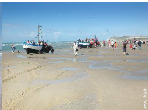
plage de sable