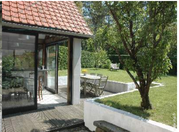
vue depuis la terrasse