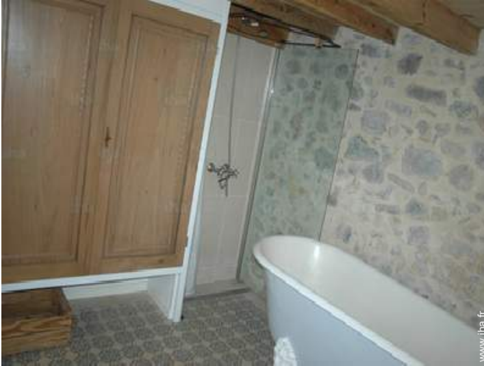
salle(s) de bain