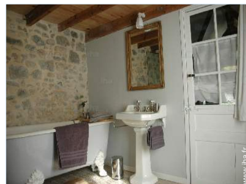
salle(s) de bain