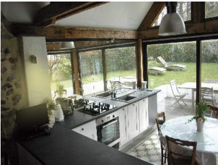
vue depuis la cuisine