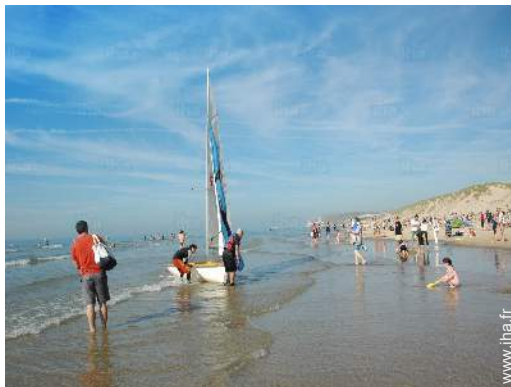
plage de sable