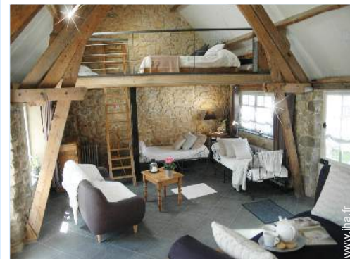
Propriété de Charme