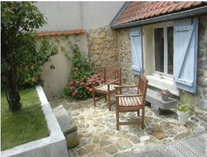
Maison en Pierre