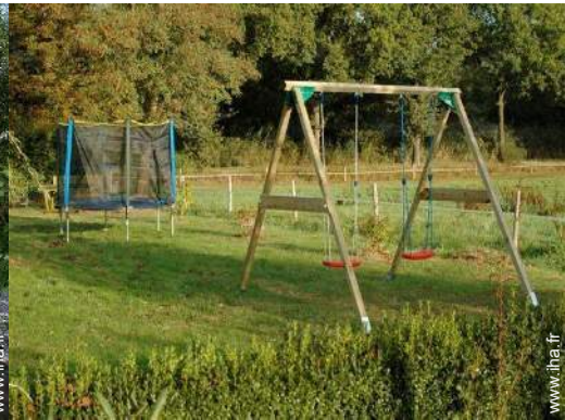
aménagement de loisirs