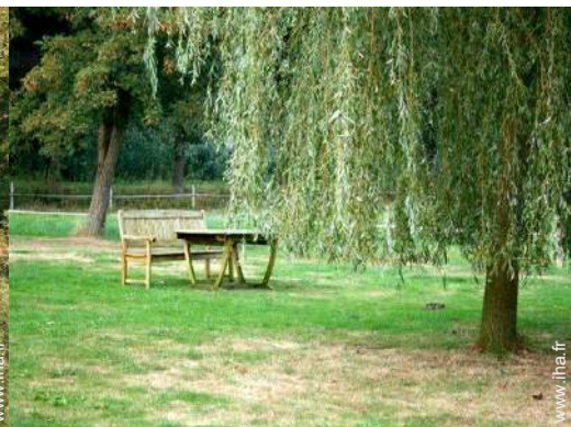
aménagement de loisirs