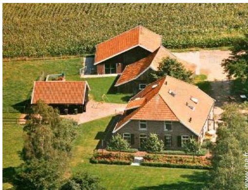
vue de la propriété