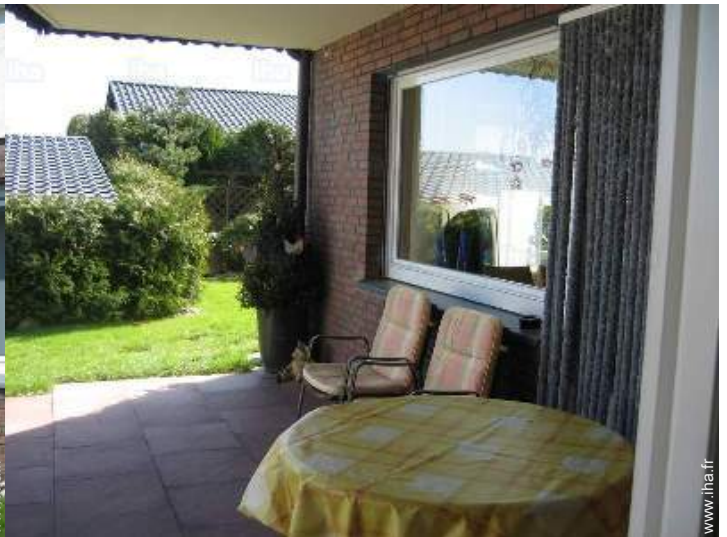
vue sur jardin/parc