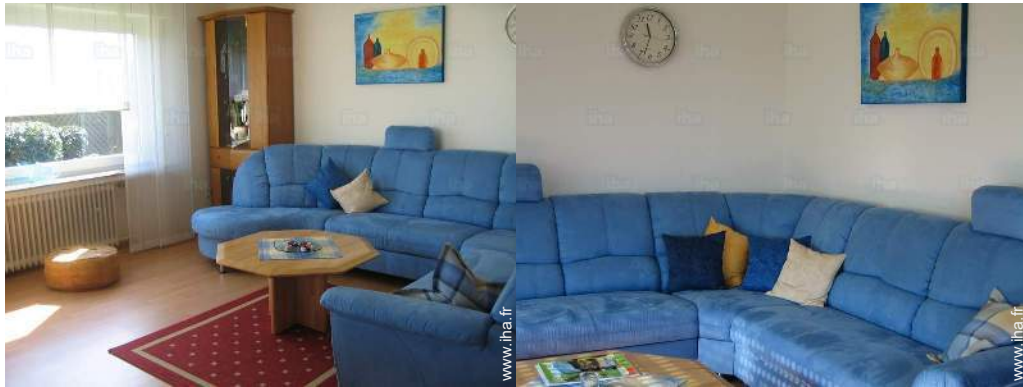
Confort intérieur et équipements