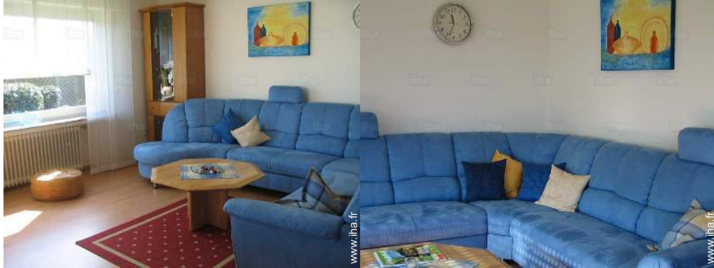
Confort intérieur et équipements