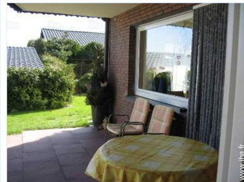
vue sur jardin/parc

Centre village 2,5km Centre ville 10km Arrêt/station de bus 1km Location de vélo/VTT 50m Location de voiture 15km Boulangerie 1,5km Traiteur 15km Petits commerces 3km Super marché 3km Boutiques de luxe et marques 20km Salon de coiffure 2km Poste 2km Banque 2km Distributeur automatique de billets 1,5km Pharmacie 2,5km Médecin 1km Infirmière Hôpital 10km