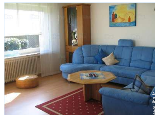
Confort intérieur et équipements