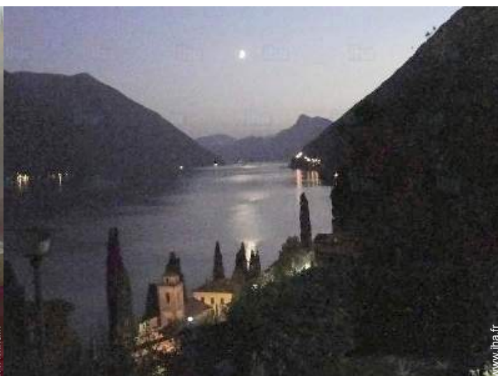
vue depuis l'appartement