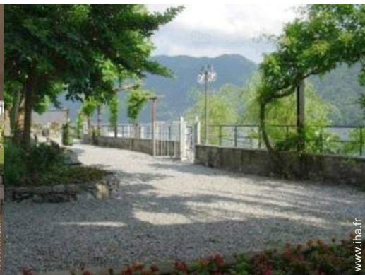
loisirs balnéaires à proximité