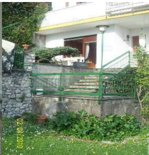
vue de la propriété