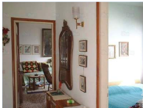
Agencement intérieur et commodités