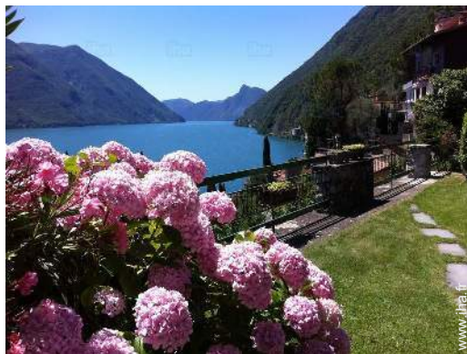
vue depuis la chambre