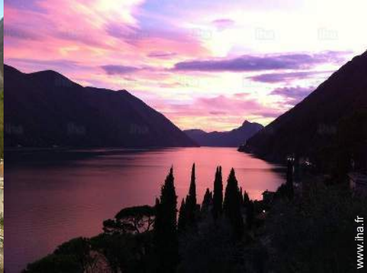
vue sur coucher de soleil