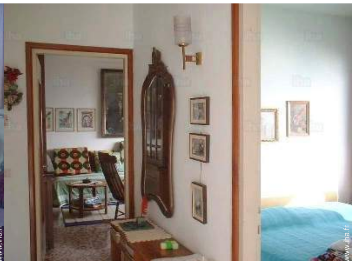
Agencement intérieur et commodités