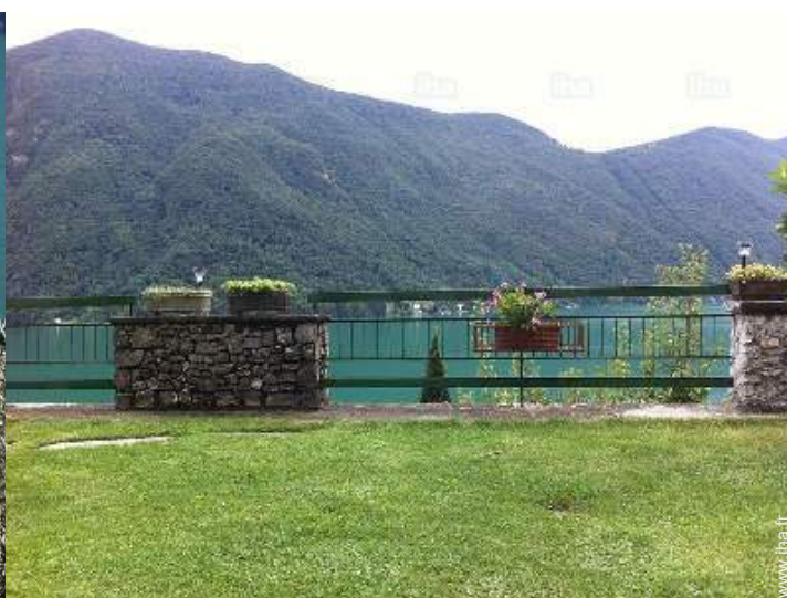
vue depuis le jardin/parc