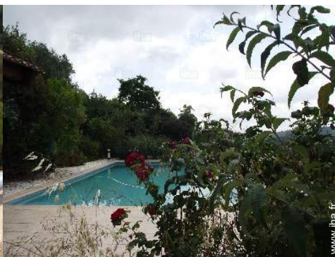
Piscine à débordement