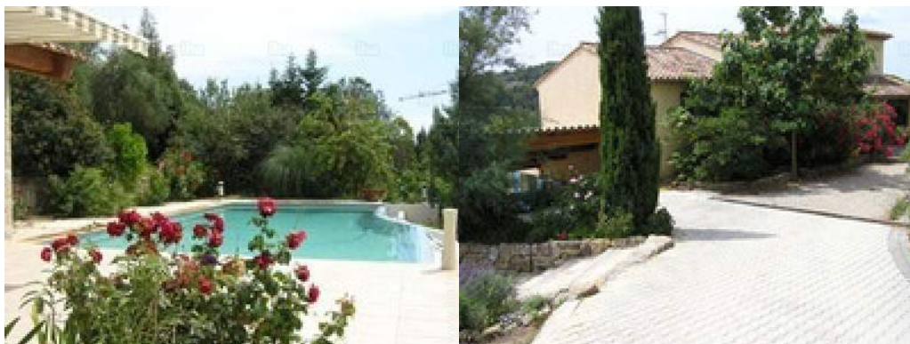
vue sur piscine