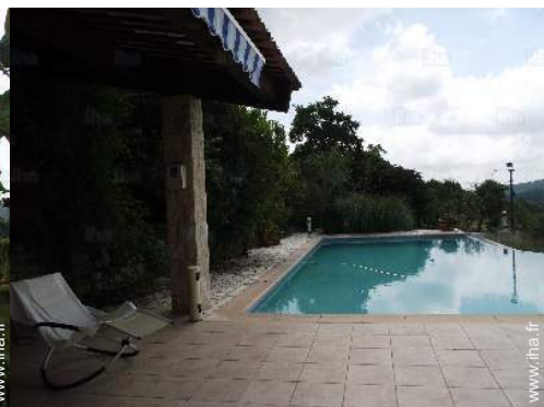
vue sur piscine