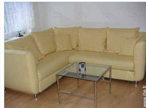
vue depuis le séjour

Patinoire 15km Piscine chauffée 5km Piscine publique 2,5km Court de tennis public 3km Parcours de golf 9 trous Parcours de golf 18 trous Base aéronautique 15km Lac 5km Forêt 300m