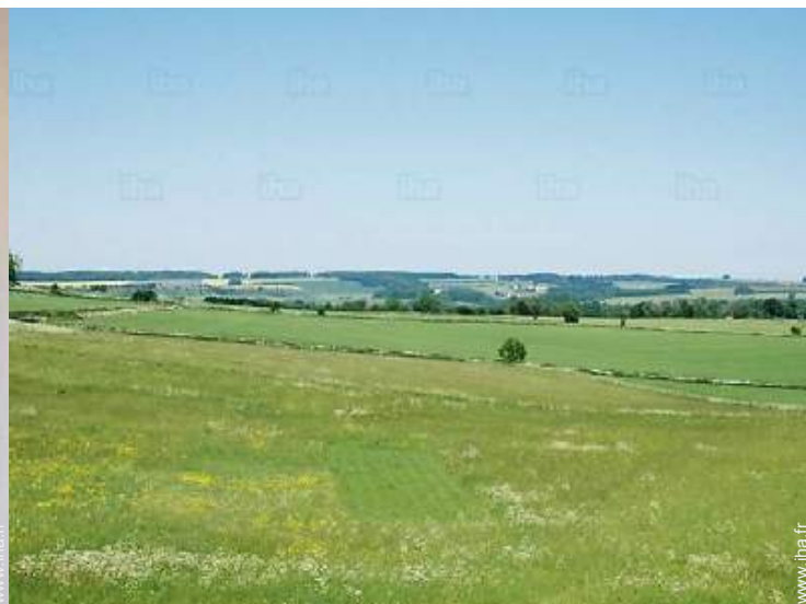
vue depuis la terrasse