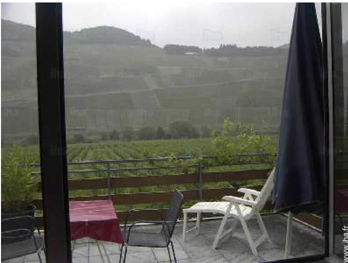
vue depuis le balcon