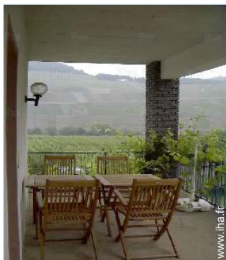
vue depuis le balcon