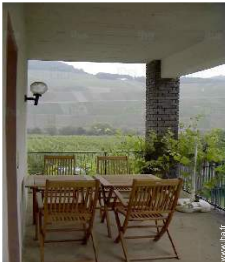
vue depuis le balcon