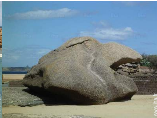
loisirs balnéaires à proximité