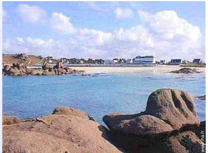
loisirs à proximité