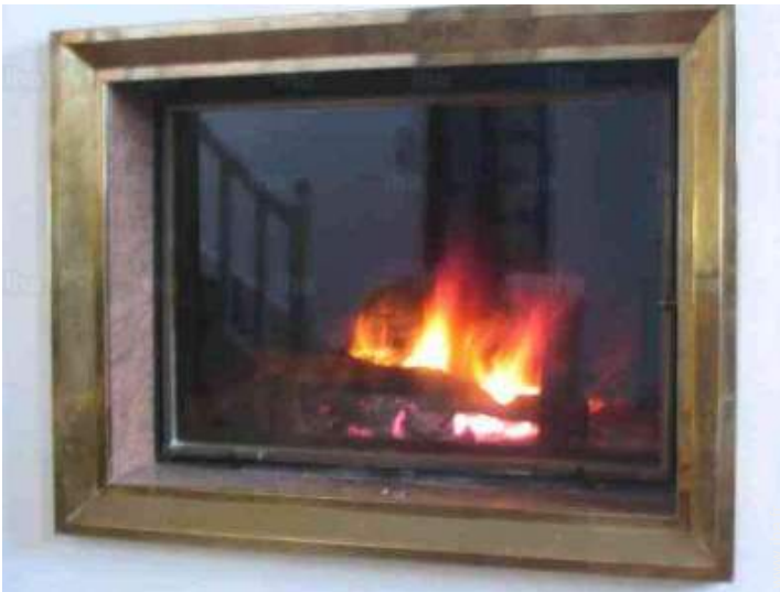
coin du feu