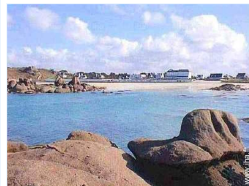
loisirs à proximité