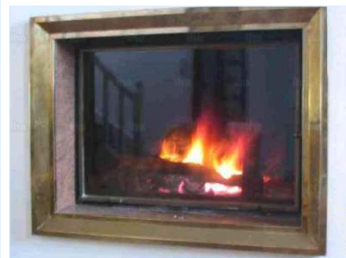
coin du feu