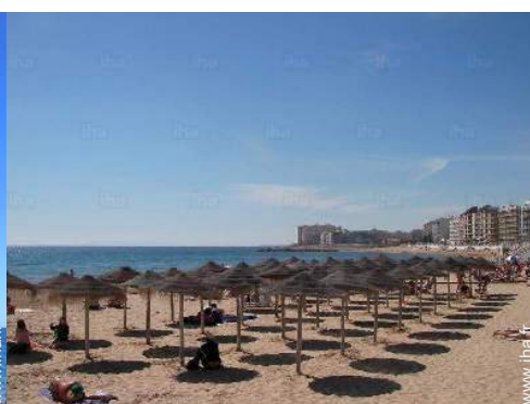
loisirs balnéaires à proximité