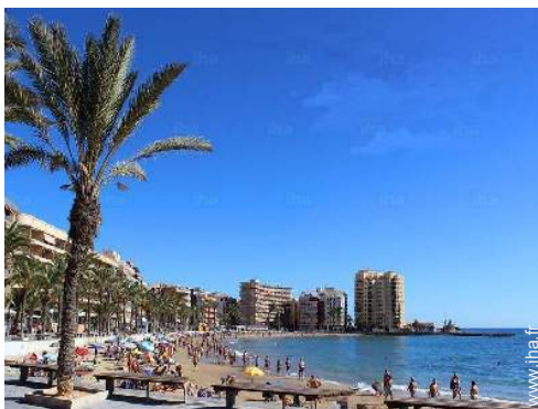
accès direct plage