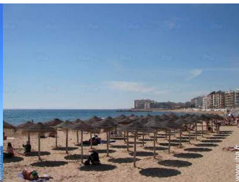
loisirs balnéaires à proximité