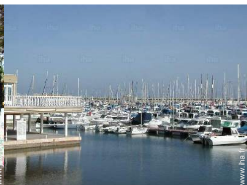
port de plaisance