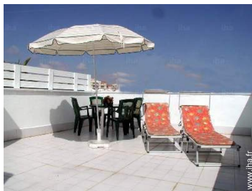
terrasse sur toit