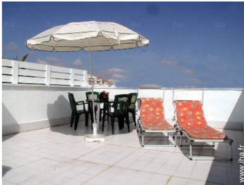
terrasse sur toit