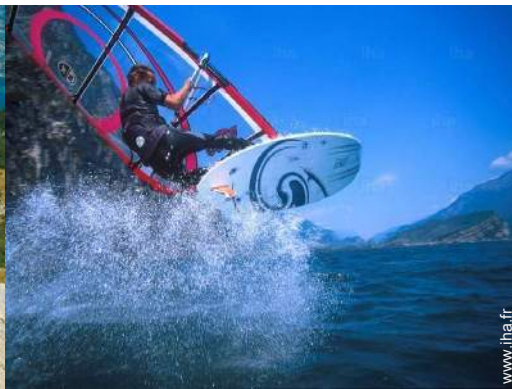
planche à voile