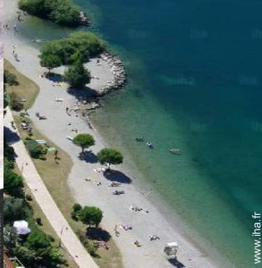
plage de galets