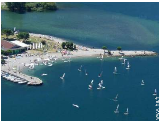
planche à voile