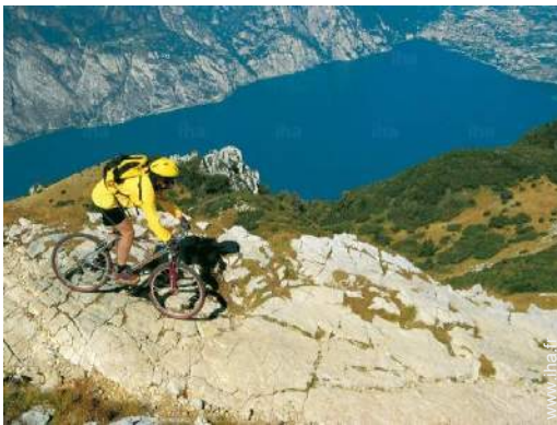
VTT (itinéraire circuit)