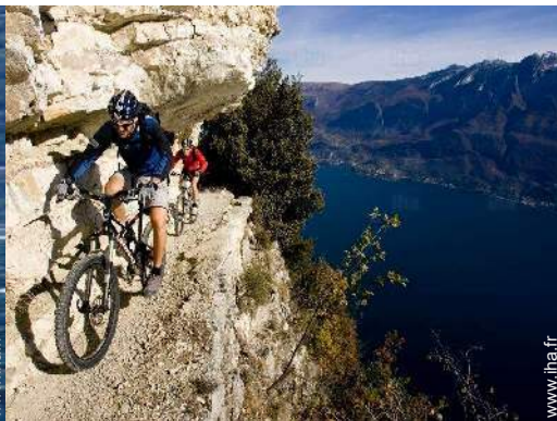
VTT (itinéraire circuit)