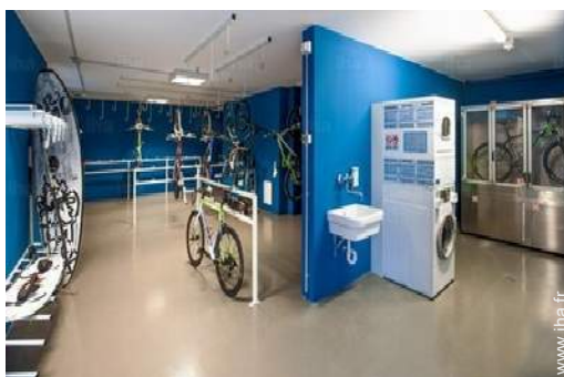
Equipements à disposition