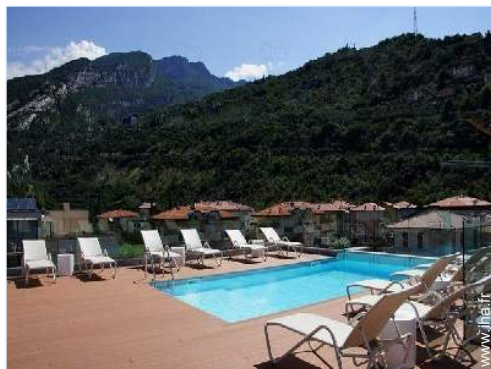
Piscine à débordement