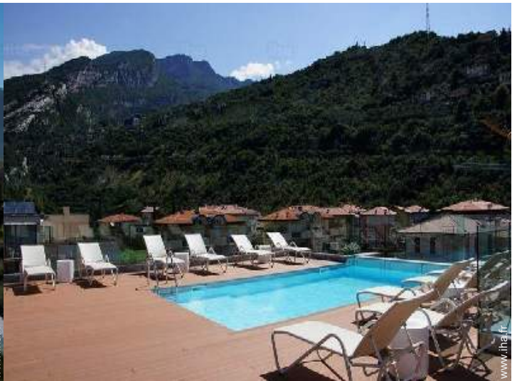
Piscine à débordement