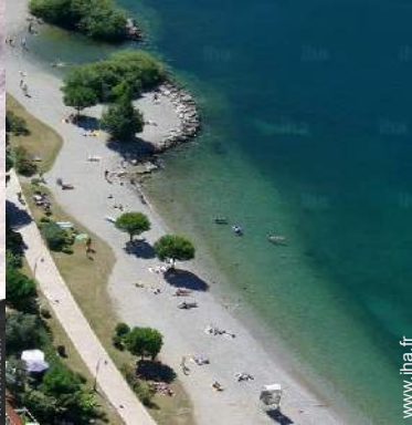
plage de galets