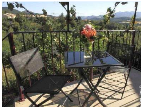
vue depuis la terrasse