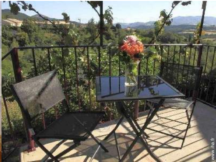
vue depuis la terrasse