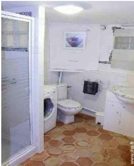
salle(s) de douche