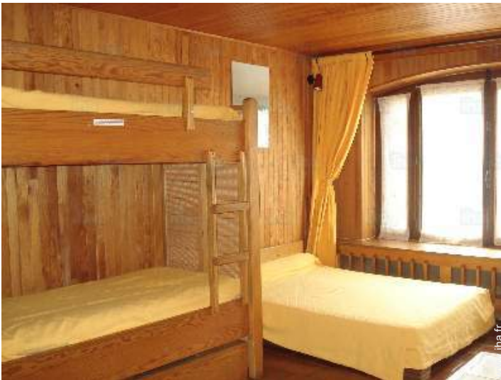
Couchage - lit(s)