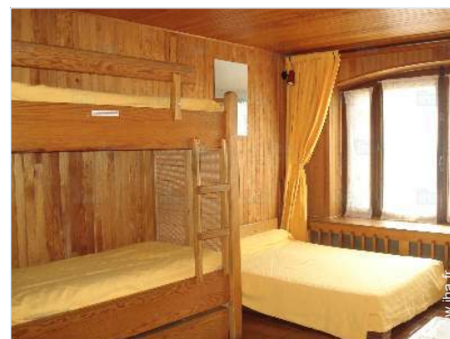
Couchage - lit(s)