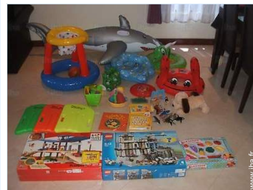
aménagement de loisirs