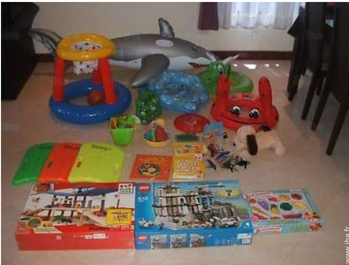
aménagement de loisirs