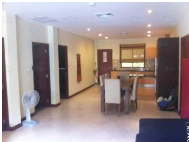
vue depuis la salle à manger