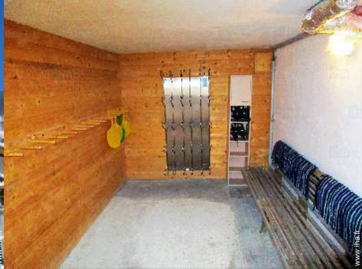
local à ski