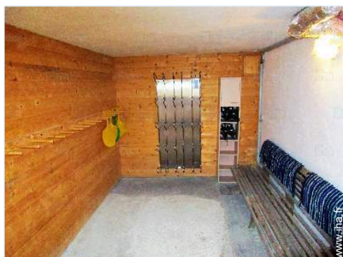
local à ski