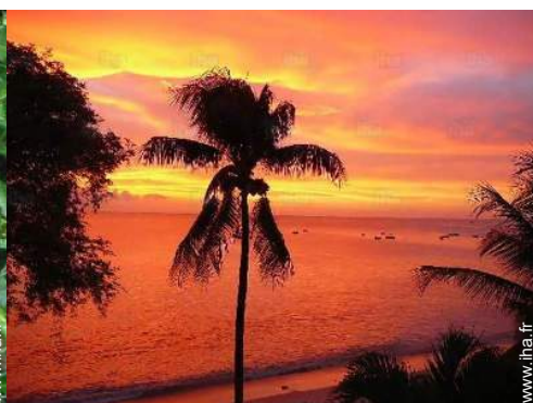
vue sur coucher de soleil