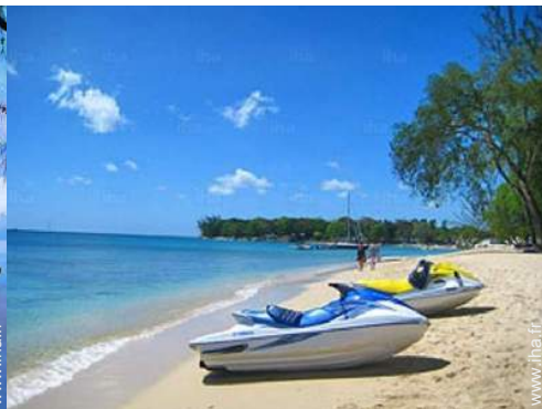
loisirs nautiques à proximité