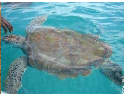
loisirs à proximité