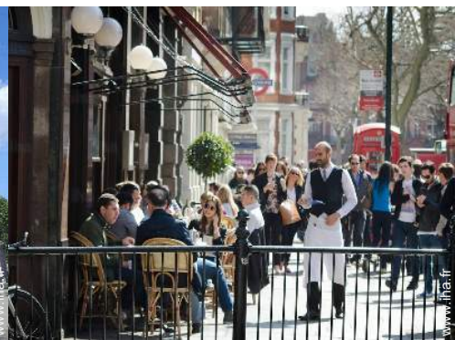
Attraites et détente