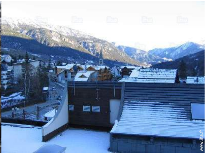
vue depuis l'appartement