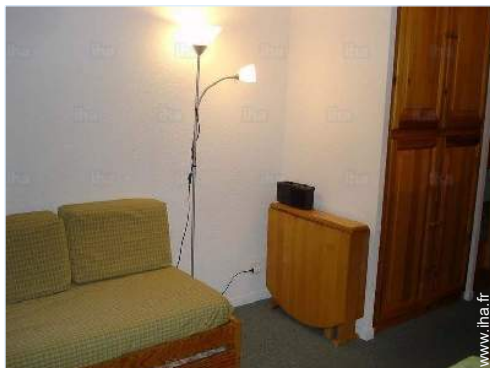
lit(s) escamotable(s) 2 pers