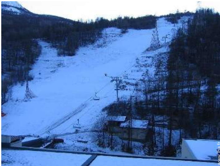
vue depuis le balcon