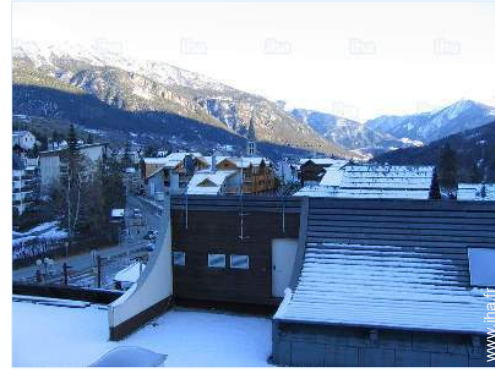
vue depuis l'appartement