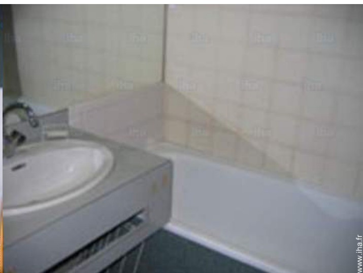
salle(s) de bain