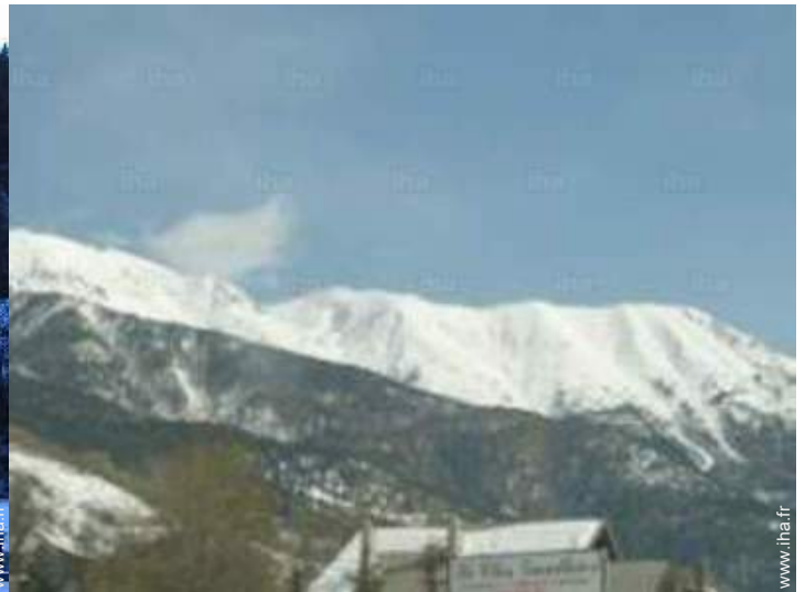
vue depuis le balcon