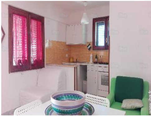
coin du feu