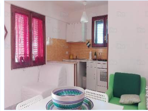
coin du feu