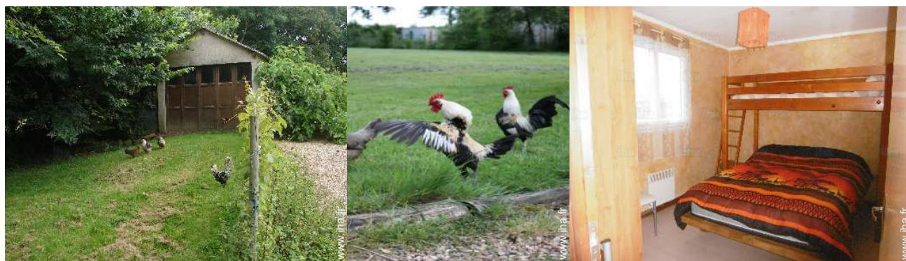
Les animaux de la maison