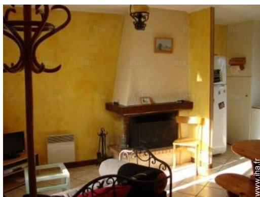
coin du feu