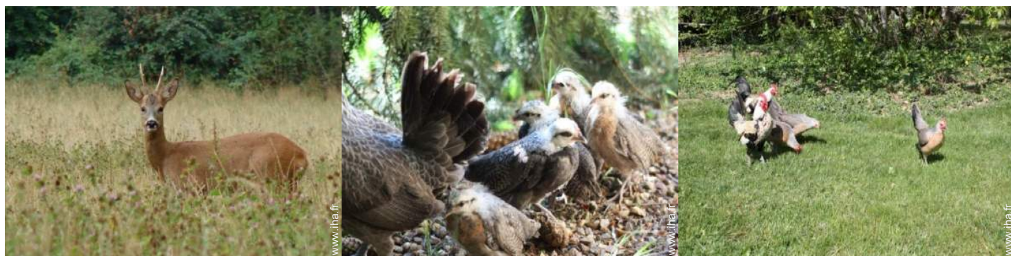
vue sur campagne