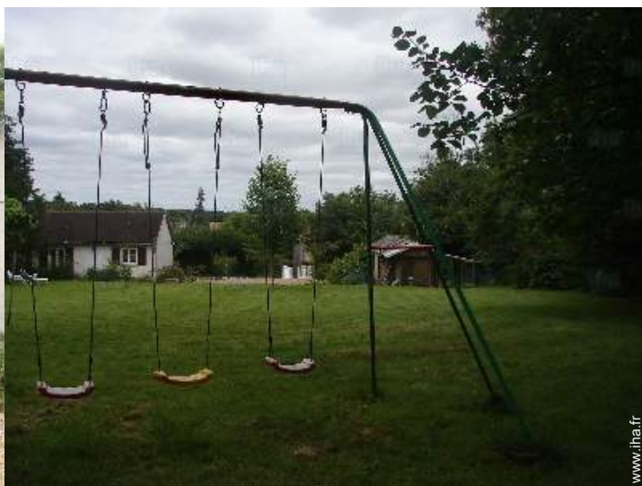
aménagement de loisirs