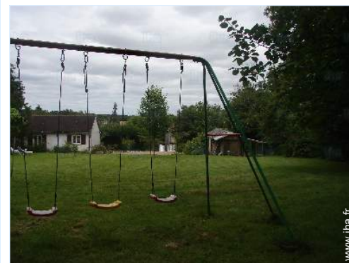
aménagement de loisirs

Piscine publique 7,5km Rivière 10km Plan d'eau 1km