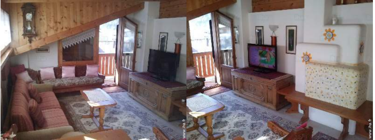
vue depuis le séjour