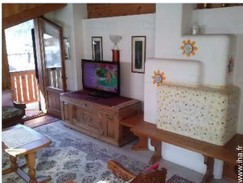
vue depuis le séjour