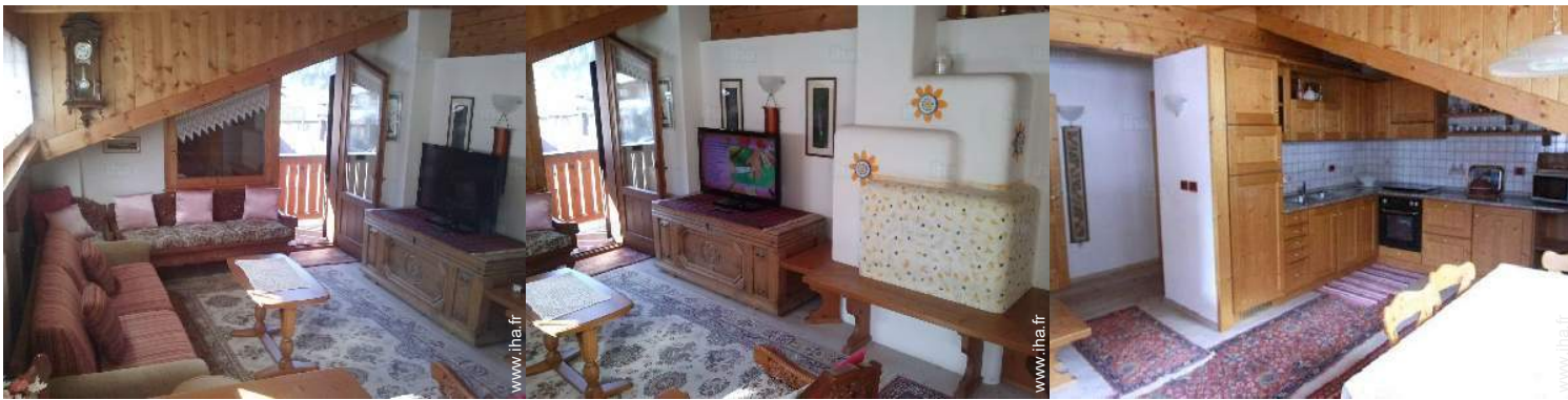
vue depuis le séjour