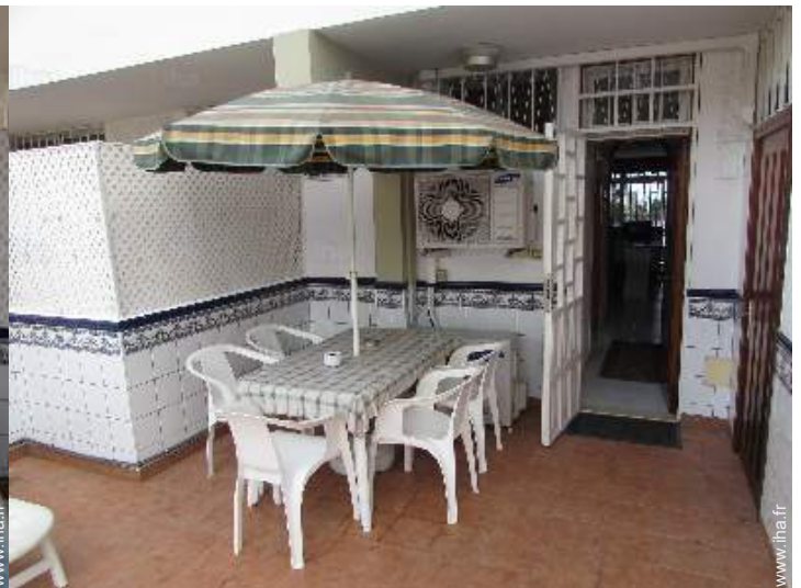
table(s) de jardin