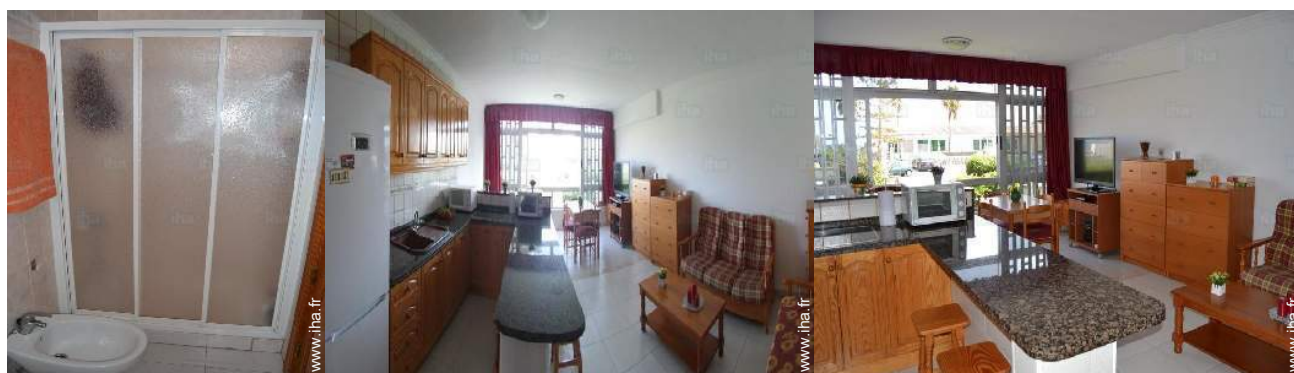
salle(s) de bain