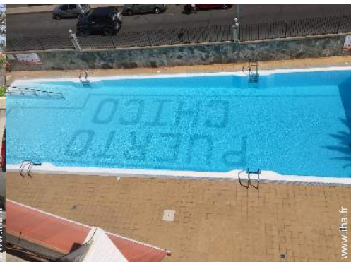
vue sur piscine