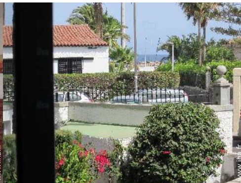
vue depuis le séjour