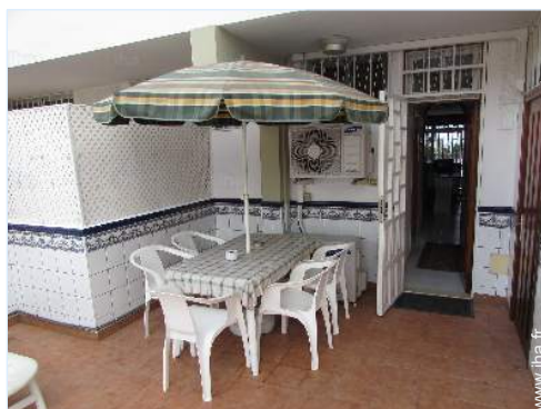
table(s) de jardin