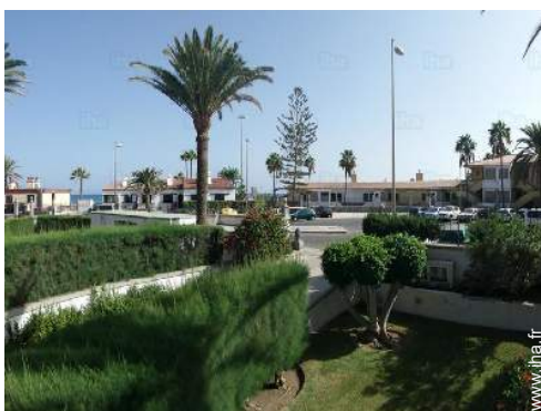
vue depuis le séjour