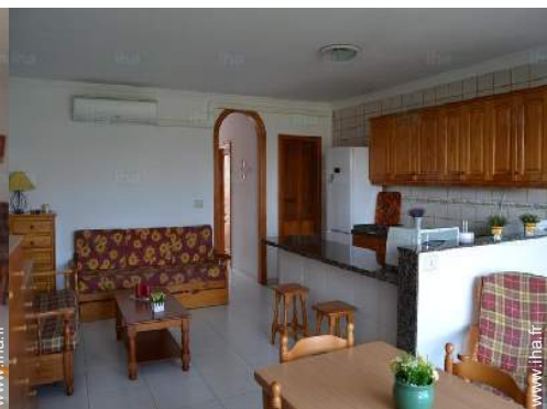
canapé-lit(s) 2 pers