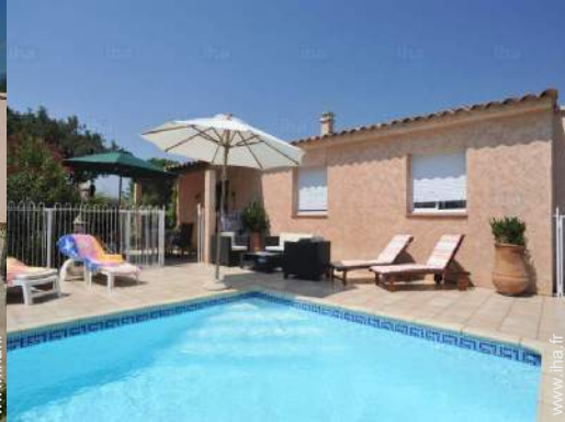
vue sur piscine