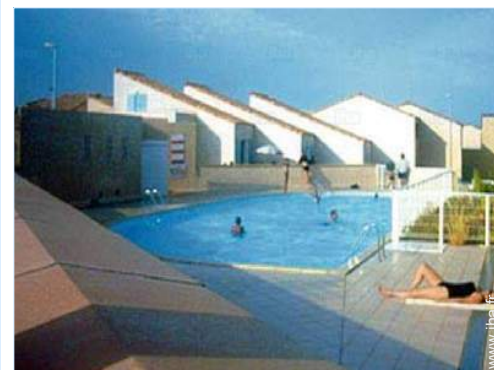
vue depuis la terrasse

Centre village 1km Arrêt/station de bus 200m Liaison bus plage 200m Location de moto/scooter 2km Location de bateau 3km Boulangerie 1km Traiteur 1km Petits commerces 1km Super marché 1km Salon de coiffure 1,5km Poste 1,5km Banque 1,5km Distributeur automatique de billets 1,5km Pharmacie 1,5km Médecin 1,5km Infirmière 1,5km Hôpital 15km