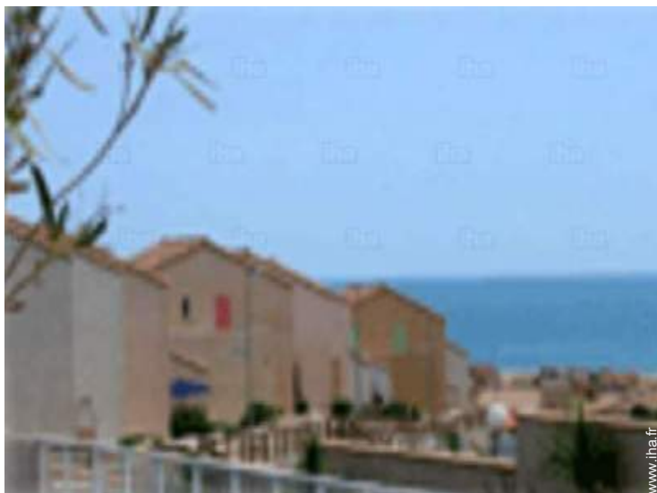
vue sur mer