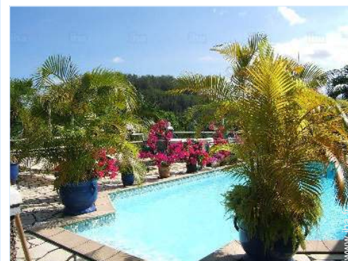
piscine dans la résidence