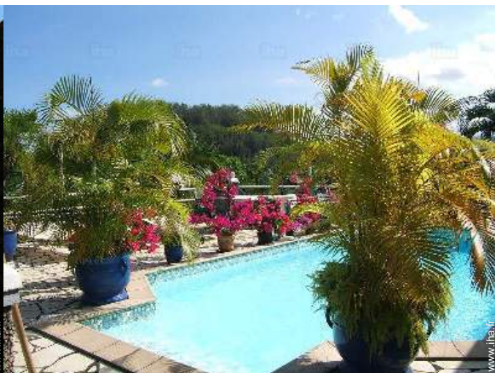
piscine dans la résidence