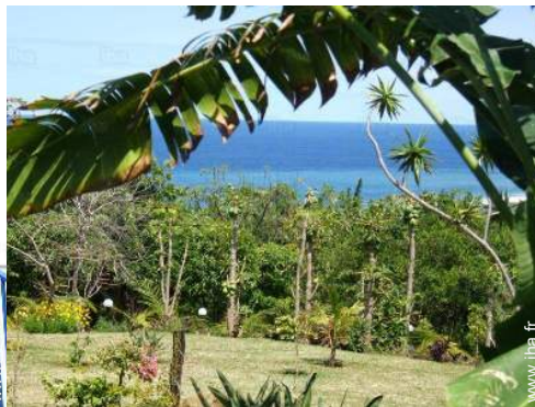
vue depuis le jardin/parc