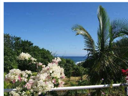
vue depuis la piscine

Centre ville 800m Arrêt/station de bus 800m Location de voiture 300m Boulangerie 800m Petits commerces 500m Super marché 800m Boutiques de luxe et marques 1km Salon de coiffure 500m Cyber café 15km Poste 1km Banque 800m Distributeur automatique de billets 1km Pharmacie 500m Médecin 800m Hôpital 800m