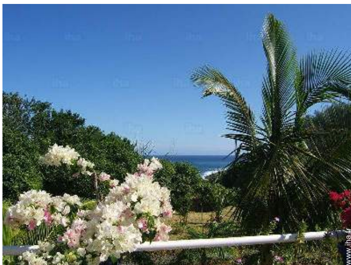
vue depuis la piscine