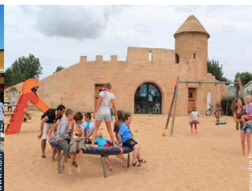
Equipements de loisir