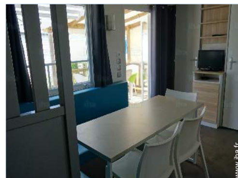
Confort intérieur et équipements