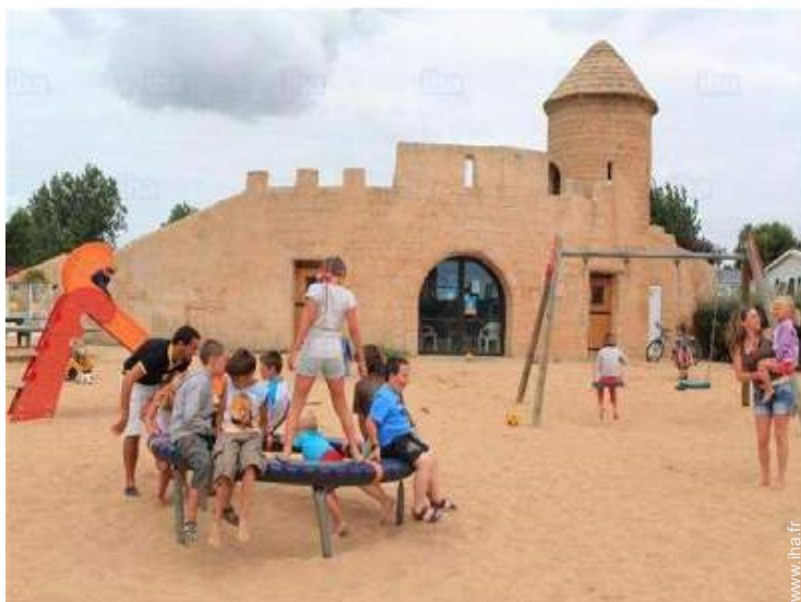
Equipements de loisir