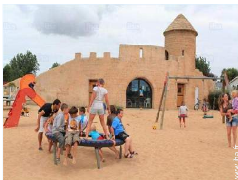
Equipements de loisir