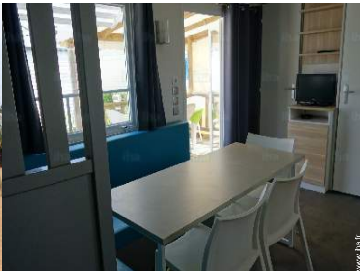
Confort intérieur et équipements