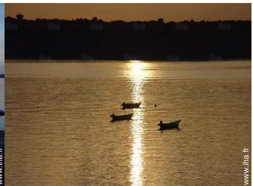
vue sur coucher de soleil