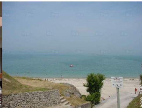
accès direct plage