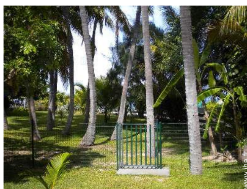
vue depuis la véranda