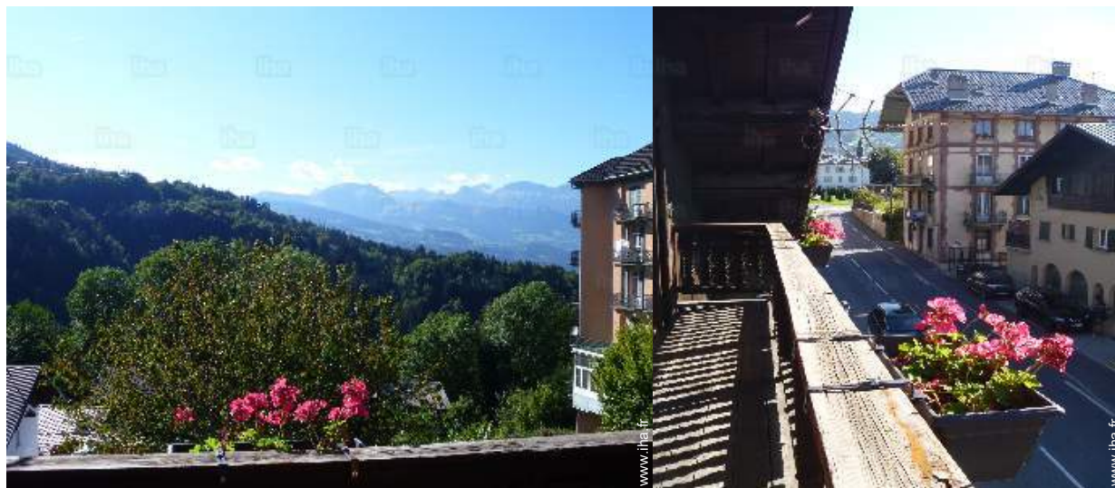
vue depuis le balcon