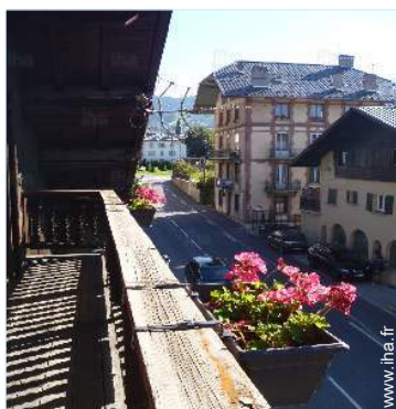
vue depuis le balcon