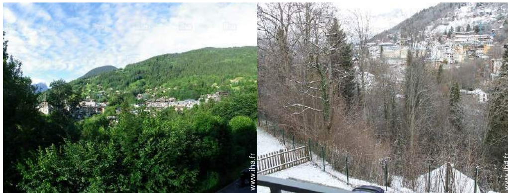
vue depuis le salon