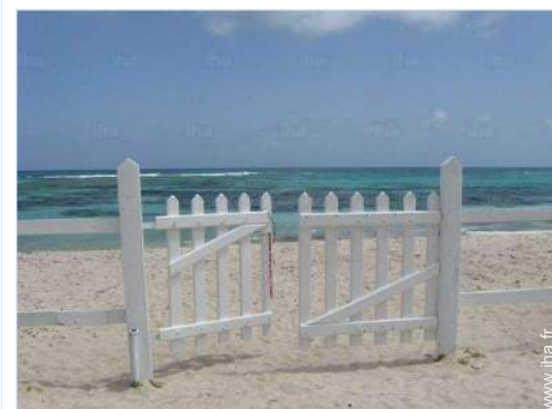
accès direct plage