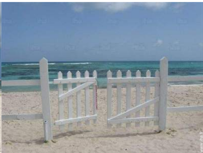
accès direct plage