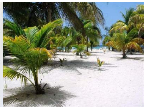
vue depuis la maison