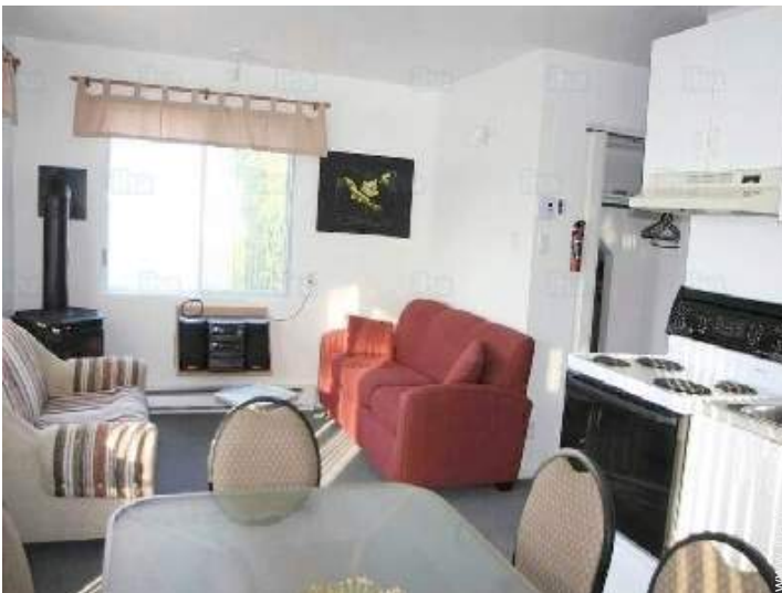
coin du feu