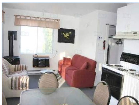
coin du feu

Enfants bienvenus Animaux refusés Présence sur place : animaux domestiques Location non fumeur, couverture téléphonique mobile, transport personnel souhaitable Eau : chaude/froide Tension électrique : 110-120V / 60Hz