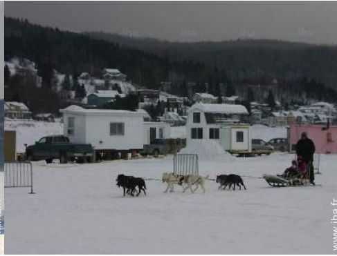
traîneau à chien