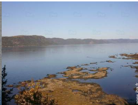
loisirs nautiques à proximité