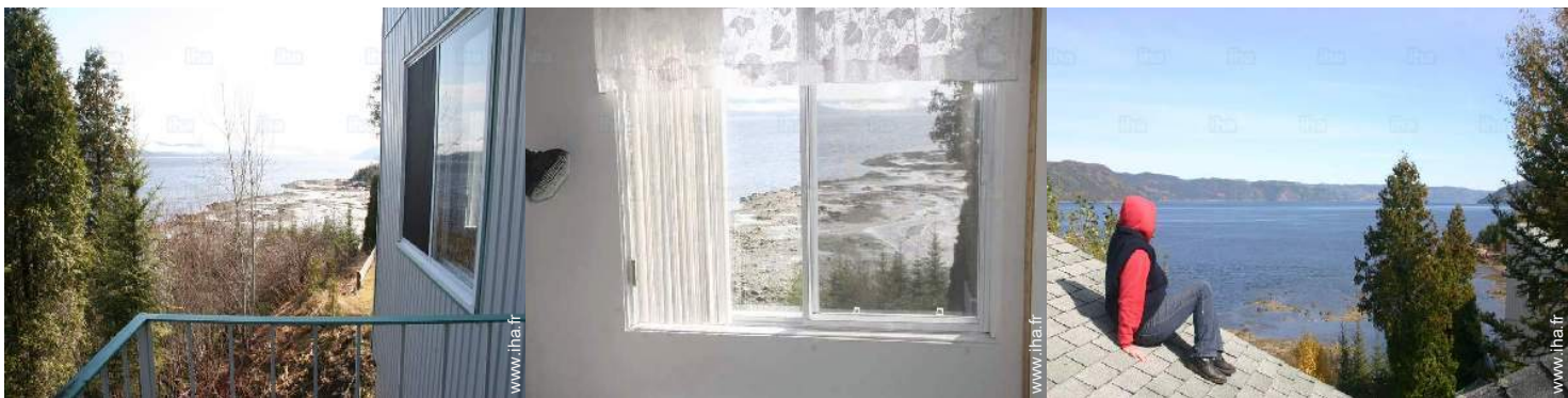
vue depuis le balcon