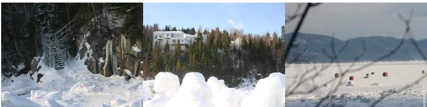
accès direct plage