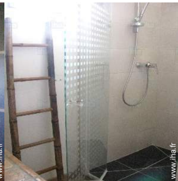
salle(s) de douche