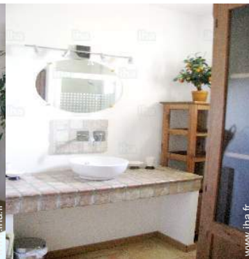
salle(s) de douche