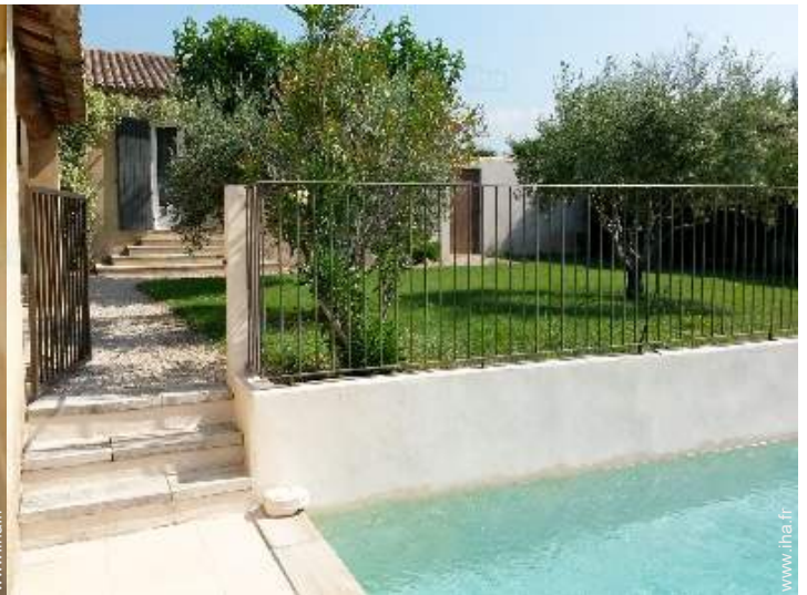
vue depuis la piscine