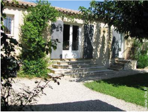
vue depuis la terrasse couverte