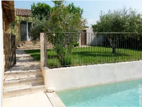
vue depuis la piscine