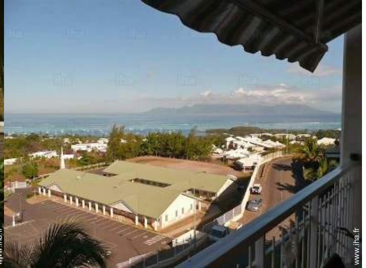
vue depuis la terrasse couverte