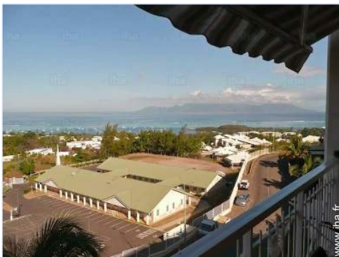
vue depuis la terrasse couverte