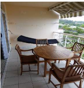
vue depuis la terrasse couverte