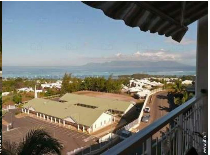
vue depuis la terrasse couverte