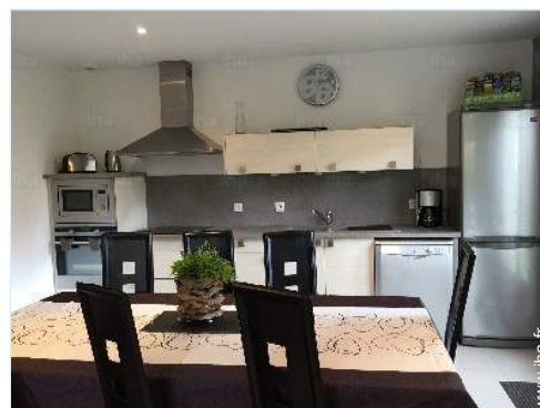
grande cuisine américaine