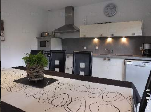
grande cuisine américaine