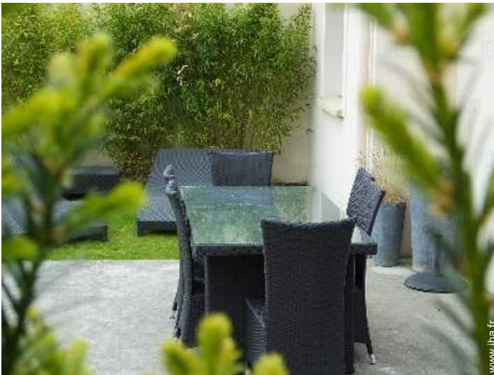
Equipements à disposition