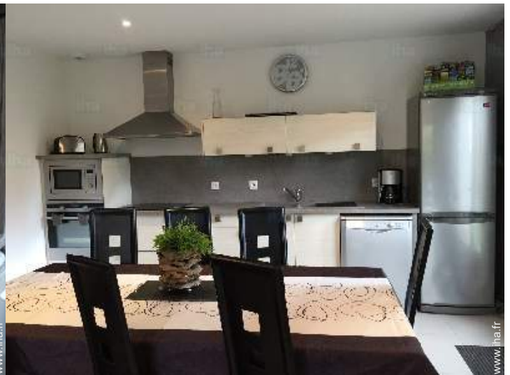
grande cuisine américaine