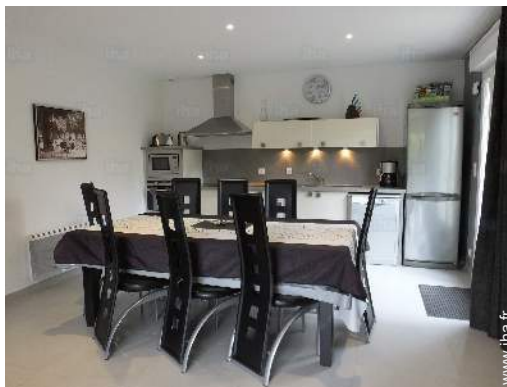
grande cuisine américaine