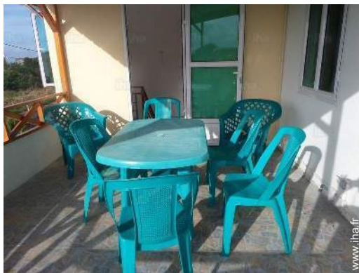
chaise(s) de jardin