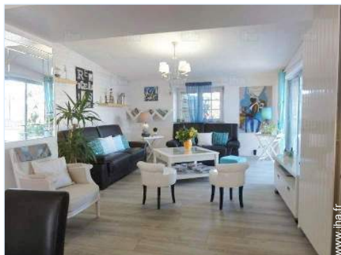
Agencement intérieur et commodités