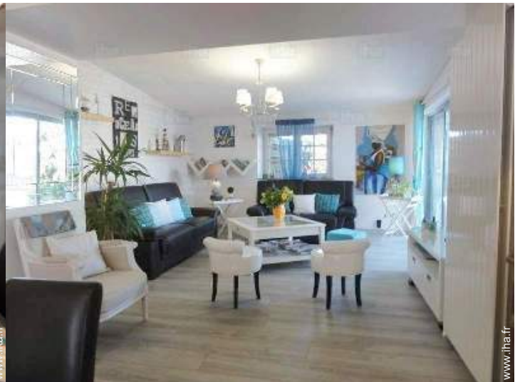
Agencement intérieur et commodités