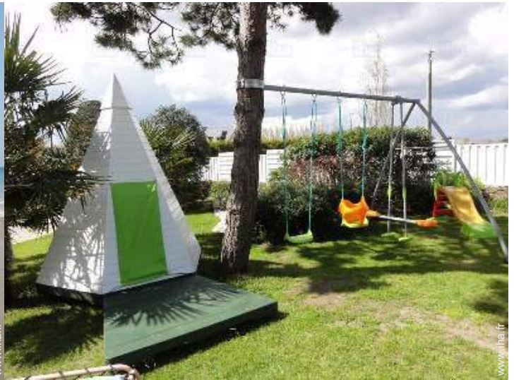
Equipements de loisir