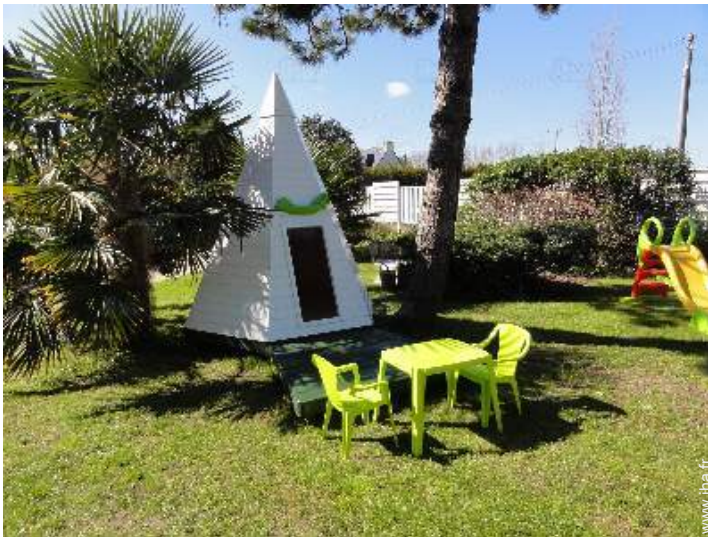
Equipements de loisir