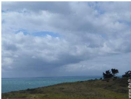
vue depuis la terrasse