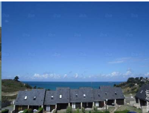
vue depuis la chambre