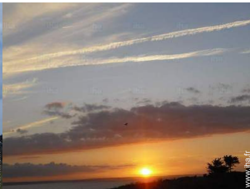
vue depuis la terrasse