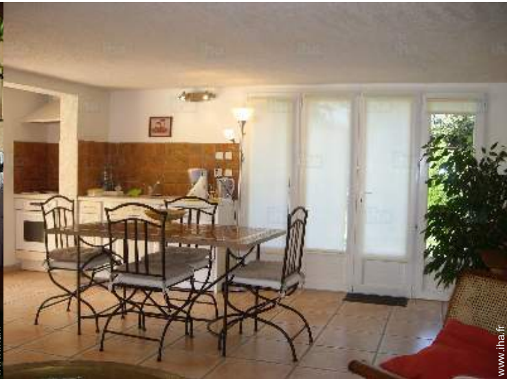
vue depuis le salon