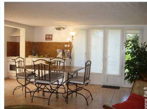
vue depuis le salon