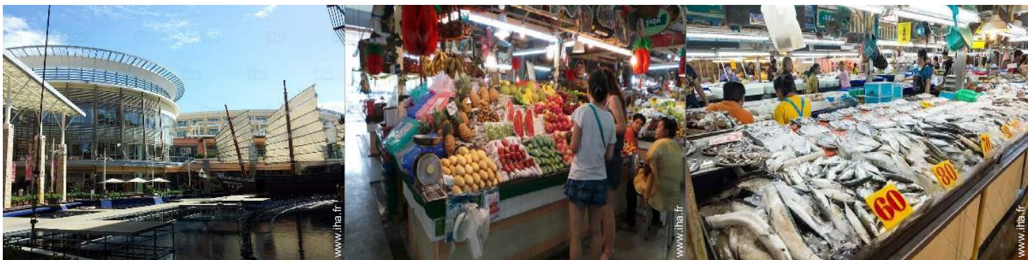
boutiques de luxe et marques