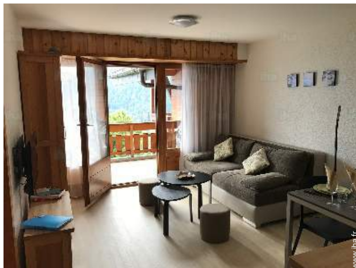
vue depuis le salon