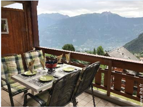
vue depuis le balcon