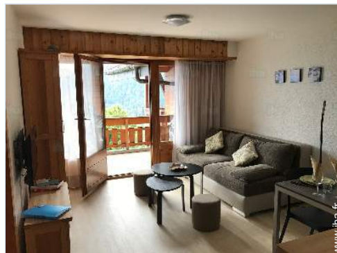
vue depuis le salon