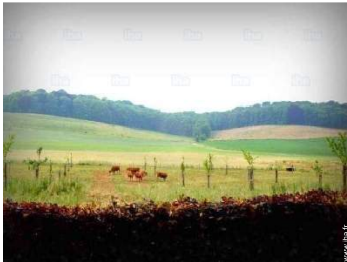
vue depuis le jardin/parc