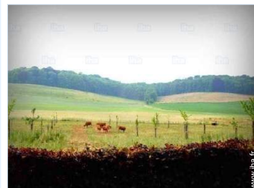
vue depuis le jardin/parc