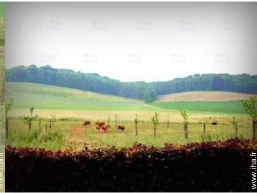
vue depuis le jardin/parc